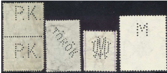
Céglyukasztásos bélyegek 5

A postai alkalmazott, ha nem céges borítékon talált céglyukasztásos bélyeget, felhívta az illető vállalat figyelmét a lopásra.