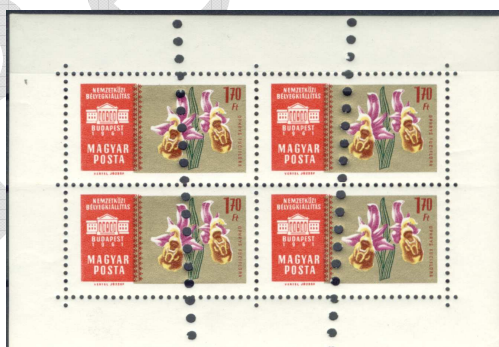
Megsemmisítő lyukasztás 7

Megsemmisítési céllal a kimaradt, felhasználásra nem került bélyegeket megsemmisítő lyukasztással látják el.