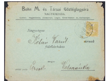
Céges boríték a XX. század elejéről 8

Céges boríték: cégek által használt, a cég jelvényét, logóját tartalmazó boríték.