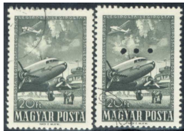
Lyukasztás nélküli és hármassal lyukasztású bélyeg 6

Beszélnünk kell még a bélyegek lyukasztásának egy különleges módjáról. 1957-ben adták ki az 1950-es „Repülő” sorozat 20 Ft névértékű záró értékét . A posta a bélyeget vízszintes hármassal is kiadta, de ezt a postahivatalok nem árusították.