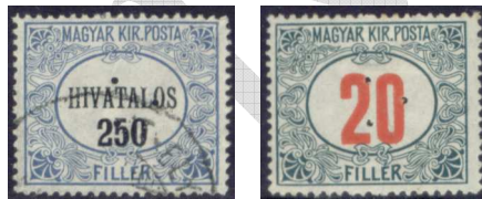
Hivatalos és Pirosszámú zöldportó hármassal lyukasztással 2

Ugyanezt tették a „Hivatalos” és a „Pirosszámú zöldportó” bélyegekkel is a magyar posta részéről.