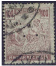
Hármassal lyukasztású „Aratós” bélyeg 1

A magyar posta 1906-ban Budapest 4 és 6 hivatalában a helyi ajánlott levelek felvételekor AUT lyukasztású „Turul” 10 filléres bélyeget ragasztottak fel. Ezeket a bélyegeket 1907 közepéig használták, levélben nagyon ritkák és értékesek. 1921-ben az aratós és parlamentes bélyegek íveit hármassal lyukasztással látták el. Az aratós bélyegek két középső függőleges oszlopát, a parlamentes bélyegek két középső vízszintes sorát lyukasztották ki.