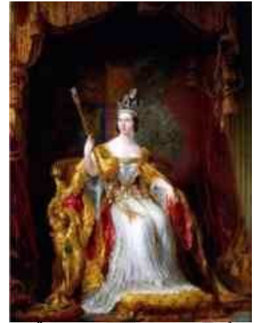
Őfelsége Viktória királynő 3

Ennek az volt a lényege, hogy a postai értékcsikkek eltulajdonításának megelőzésére ezek a cégek a cégnévre jellemző betűket vagy ábrát lyukasztottak az általuk használt értékcsikkekre.