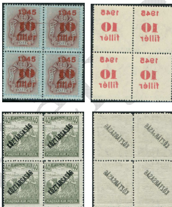
Bélyegek felülnyomatának tükörnyomatai 2