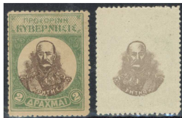
Kréta 1905. György királyról kiadott bélyeg, ill. a tükörnyomata 1

Korábban már tárgyaltuk, hogy a bélyegek hátoldala valamilyen ragasztóval (természetes, szintetikus) van bevonva, hogy könnyen felragasztható legyen a postai küldeményre. Ezt nevezik gumizásnak, enyvezésnek stb. Előfordul azonban, hogy a ragasztón kívül más is kerül a bélyegek hátára. Ezt történhet véletlenül is, de számos esetben szándékosan is nyomtatnak különböző feliratokat a bélyegek hátoldalára. A legtöbb esetben valamilyen nyomdai technológiai hiba az oka annak, hogy a bélyeg „hátrára” valami nyomtatásra kerül. A hátoldalra került ábrák az eredeti ábrák tükörképei, így ezeket összefoglaló néven tükörnyomatoknak nevezzük.