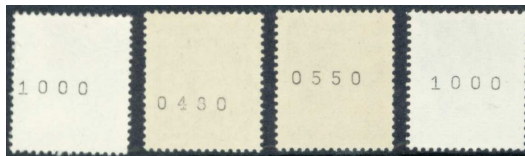
Tekercsbélyegek hátoldala ellenőrző számokkal 4

1966-tól kezdődően a magyar posta a bélyegautomaták részére gyártott tekercsbélyegek minden ötödik bélyegének hátoldalára fekete színű ellenőrző számot nyomtatott. Ezek fő funkciója a bélyegek fogyásának a figyelemmel kísérése volt.