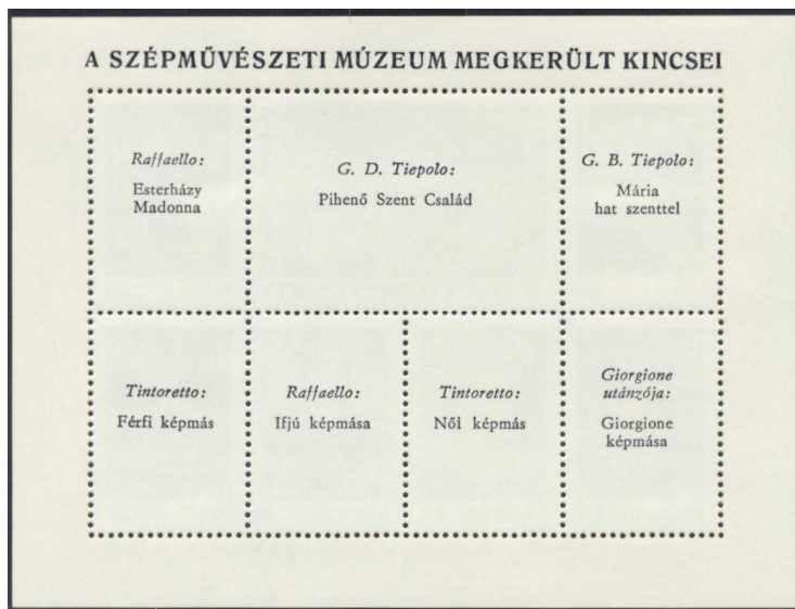
A blokk hátoldala 6

A rendőrség lelkiismeretes munkájának köszönhetően, a képek hamarabb megkerültek, mint ahogy a blokk elkészült volna, ezért a hátoldalra felkerült még „A Szépművészeti Múzeum megkerült kincsei” felirat is.