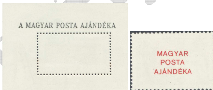
Néhány ajándék blokk, illetve bélyeg hátoldala 7