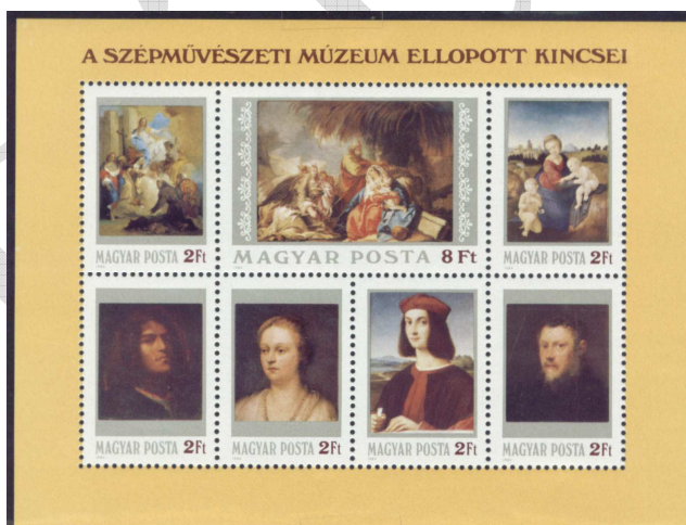
A blokk 5

1984-ben a bélyegek hátoldala (is) a kriminalisztika céljait is szolgálta. A budapesti Szépművészeti Múzeumból 7 db páratlan értékű festményt loptak el. A nyomozást megkönnyítendő, a magyar posta „A Szépművészeti Múzeum ellopott kincsei” elnevezésű blokkot tervezett kiadni, benne a hét festmény ábrázoló bélyeggel, a hátoldalára pedig minden festmény készítőjének nevét és a kép címét tervezték nyomtatni.